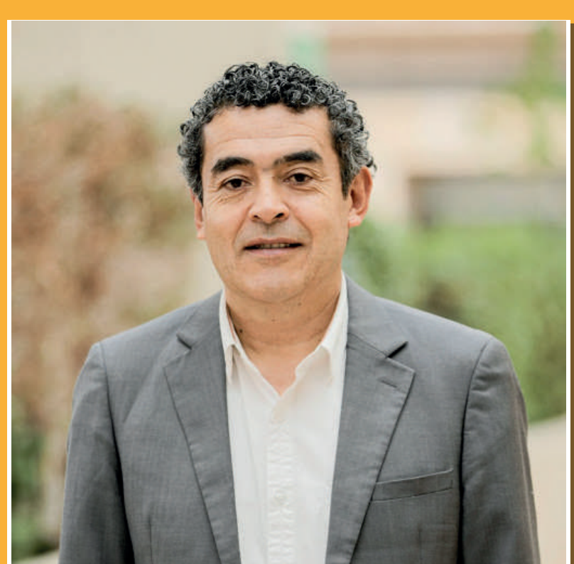
Horacio Guerrero Alcalde Local (e) de Ciudad Bolívar